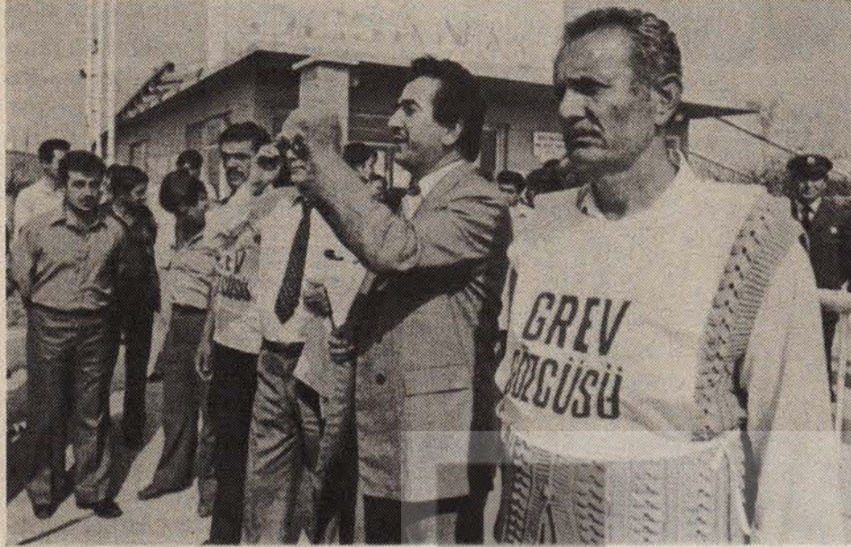
Dillere destan "Eren Demokrasi"nden bir görüntü: DESAN'da 38 işçiden 8'i "grevde"!

* Türkiye, demokratik bütün ülkelerin imzalamış bulunduğu, her ülkede işçilere sendika kurma özgürlüğü ve örgütlenme hakkı tanıyan 87 sayılı ILO sözleşmesini imzalamaktan hâlâ kaçınılmaktadır.