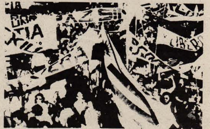
Uruguay'da demokrasi kitlelerin mücadelesiyle kazanılıyor. 27 Kasım 1983 günü Montevideo'da 400.000 kişi demokrasiye dönüşümü için gösteri yaptı.

Açık ki, Reagan yönetimi “arka avlusu” nu Pinochet ve Stroessner gibi kuklalarla güçlendirmek için Grenada'da olduğu gibi askeri işgal dahil her yola başvurmaktan çekinmeyecektir. Ne ki, Güney Amerika komünist partilerinin yaptıkları açıklamada da belirttikleri gibi, Latin Amerika'daki olayların gelişimi “ABD'nin egemenliğinin işçi sınıfının, halk kitlelerinin ve en geniş yurtsever güçlerin birliği ile yenilebileceğini ve yenilmek zorunda olduğunu” gösteriyor.