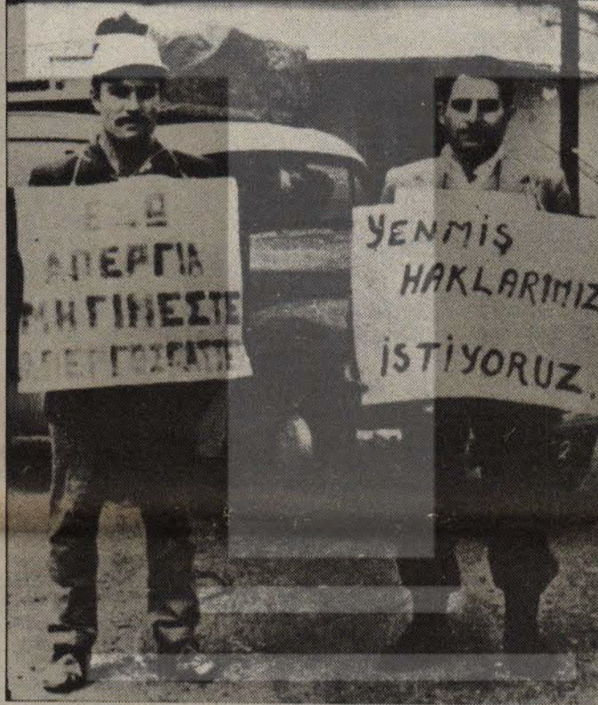
Kıbrıs İşçi Federasyonuna üye Türk ve Rum işçiler, sınıf hakları için ekonomik-demokratik hakları için yıllarca omuz omuza, birlikte mücadele vermişlerdi. 1963 yılında çekilmiş olan yukarıdaki fotoğraf bu ortak mücadelenin güzel bir örneği.

İşçilerin, emekçilerin, barıştan, güvenlikten, demokrasiden ve insanca yaşama koşullarının yaratılmasından yana ilerici, demokrat, anti-faşist bütün toplum güçlerinin, hatta insancıl bütün öğelerin ve kişilerin, atılan bu adımdan kendine pay çıkarmaları, kendi etkinlik ve çabalarını bu gelişimle birleştirmeleri, aktif mücadele dışına düşmüş, yalnız ve amaçsız kalmış ama aklında hep belli belirsiz bir gelecek umudu saklı kalmış olanların kendi durumlarına bu gelişmeden amaçsal çözümler çıkarabilmeleri, gereklidir ve mümkündür.